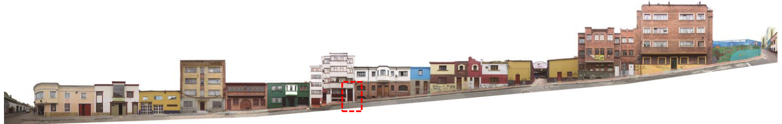
CALLE 12D BIS