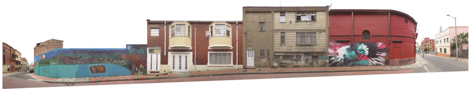
CARRERA 1 BIS